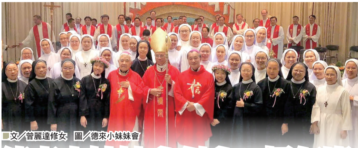
文/曾麗達修女 圖/德來小妹妹會

中華郵政台北雜字第1304號執照 發行人:洪山川/地址:(106)台北市樂利路94號/電話:(02)2737-2839/傳真:(02)2737-1326/電子郵件:catholicweekly@gmail.com