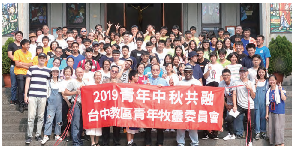
▲台中青年齊聚，中秋共融見證主愛。

高潮迭起的大地遊戲之後，在結束感恩祈禱中，全體頌唱〈天主經〉及〈聖母經〉，獻上感謝也獻上祈禱，領受了主教和司鐸的降福後，歡喜賦歸！