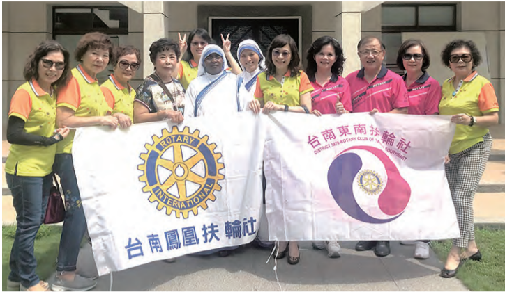
▲台南鳳凰扶輪社與東南扶輪社在台南教區德蘭園歡喜舉行捐贈儀式