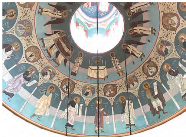
▲圖1：圓形穹頂的溼壁畫，依序為總領天使、天上教會、聖祖列宗及先知們。

在系列8中，我們對雪維凍泥爾（Chevetogne）修道院東方禮聖堂中的聖像畫屏有所認識，系列9將以聖堂的溼壁畫（les fresques）繼續進行這一場美麗的視覺巡禮。什麼是「溼壁畫」？簡而言之，就是灰泥彩繪壁畫。重點是，這層灰泥必須是濕潤的，好讓藝術家能對畫面進行修飾，一旦灰泥乾了，便無法再繼續上色。任何須進行大幅修改的畫面，都需要破壞掉原本已乾的石灰泥，再重新塗上濕潤的石灰泥層。溼壁畫上所施塗的都是天然的顏料，精細研磨並在水中稀釋後使用。