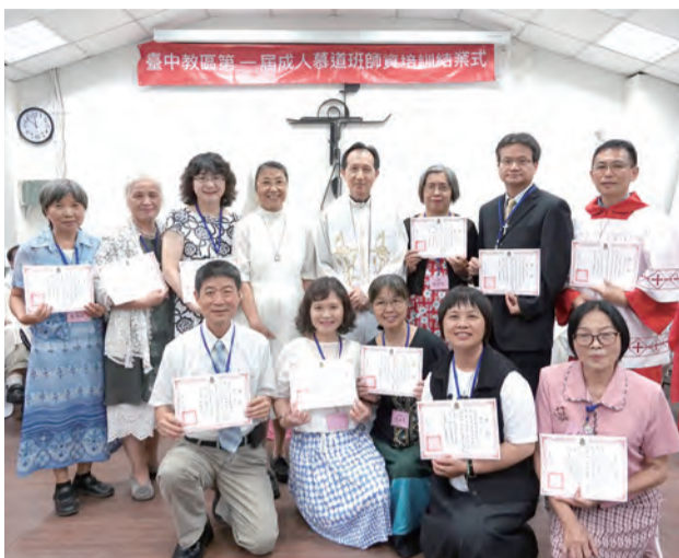
▲全勤獎學員們歡喜合影

「我們知道，福音信仰是天主白白賞賜的禮物，但卻是藉由天主子耶穌基督為愛我們而犧牲，被釘十字架死而復活的高昂代價所得來的，如同教宗方濟各在《你們要歡欣踴躍》勸諭中告訴我們的，天主愛我們，使我們成為祂的子女並分享永福的生命，是我們喜樂的原因；也因此我們需藉聖神所賜的恩寵，以聖德回應天主給我們的成聖的召叫。我們整個的生命是走向天主的旅程，藉著信、望、愛三德，更深入天主愛的奧蹟，以真福八端的精神答覆這份愛的邀請，藉由我們的交托、奉獻，求天主握住我們的手，觸碰我們的心，藉由聖神的