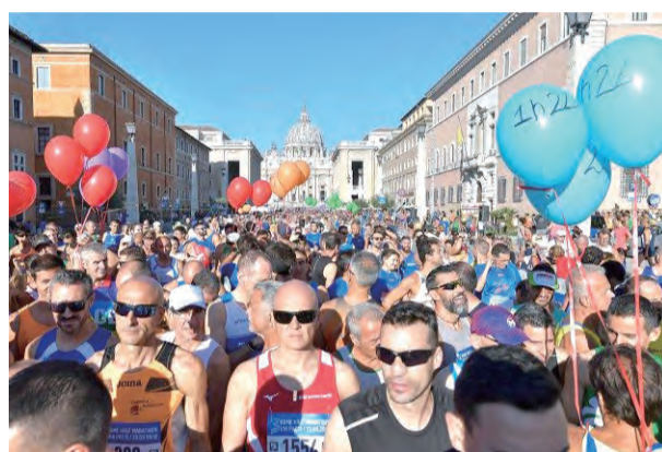
▲「和平之路」馬拉松賽在去年開跑時引起廣大迴響。

教宗最後提醒在座的神長，上主不會數算我們的轄區、管理權，或是我們對國家認同發展的貢獻。相反地，祂會問我們有多愛我們的近人、每個近人，以及我們如何向人生旅途中遇見的人宣講救恩的福音。