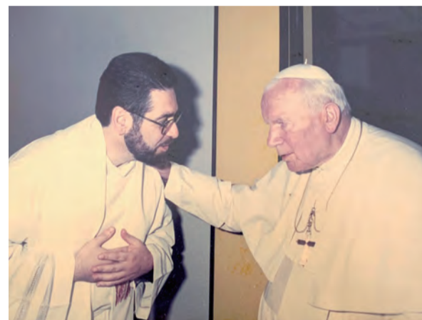
▲2001年，聖教宗若望保祿二世親自接見賜和平神父，並派遣他到台灣宣教。 ▶二空聖母升天堂祭台前壯觀的《聖母安眠》壁畫