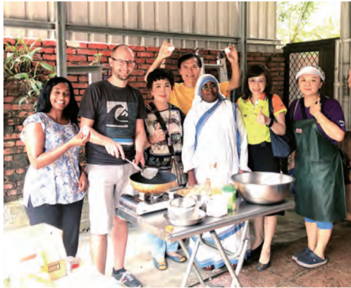
▲可愛的膳食志工與廚師