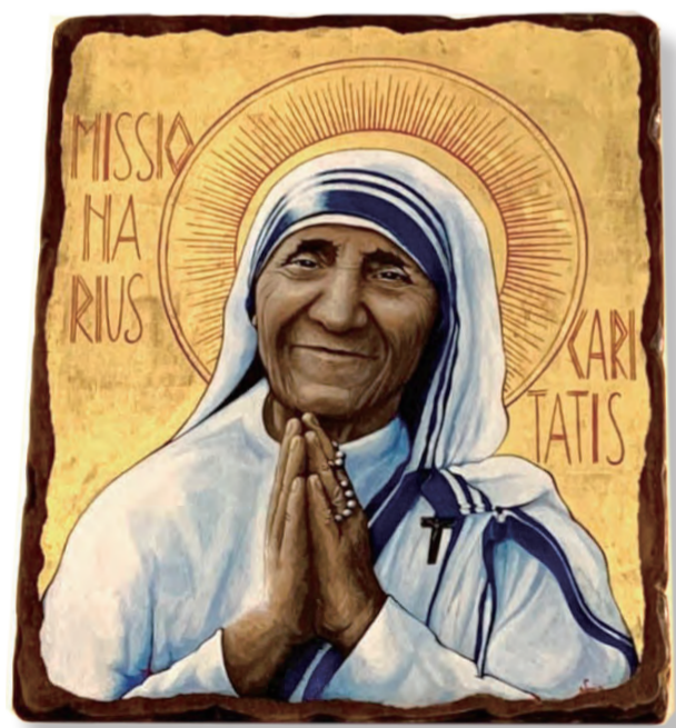
▲聖德蘭姆姆慈愛的ICON像

在2016年9月4日，聖德蘭姆姆宣聖後，賜神父向仁愛傳教修女會總會取得聖德蕾莎姆姆聖髑——姆姆滴印布上的血，永久安放在教堂祭台柱石內，供教友敬禮，在賜神父應邀在梵蒂岡參加宣聖觀禮歸來後，於10月16日下午4時感恩祭，恭請林吉男主教主禮，祝聖祭台，安放聖髑。台南教區的教友們珍視與聖德蘭姆姆的這緣份！教堂朝聖者亦絡繹不絕。