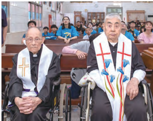
▲邀請老本堂蘭兆斯神父回來共融