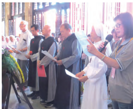
▲鳴遠家族齊聚忠烈祠，向會祖雷鳴遠神父致敬。

1940年春，國共衝突，耀漢會12位修士慘遭共軍殺害，共軍擊潰河北省府鹿鍾麟部隊；同年3月9日，雷神父被共軍誘禁於山西遼縣40餘日，備受摧殘，經中央政府幾番交涉，始獲釋放，但已病入膏肓，於6月24日逝世於重慶歌樂