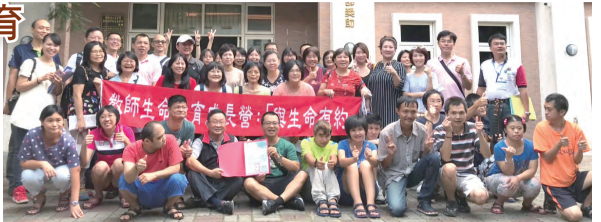
▲生命教育夥伴們在華聖啟能發展中心服務，身心靈得到滿滿收穫。

第3站安排了生態探索與環境體驗教育。很榮幸在生命教育研習之旅中能聆聽到中正大學王瓊玲老師的演講，深切體會我們的文化傳