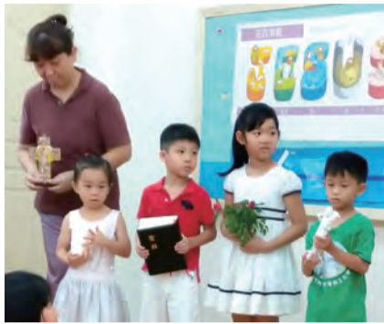
▲小朋友認真學習聖祭禮儀

主救贖工程的耶穌在世上生活的地方與傳揚天國的足跡。教具琳瑯滿目，孩子的眼睛發亮，家長臉龐堆滿笑容，期許孩子藉由善牧課程更認識天主的愛，更積極的參與感恩禮儀，讓孩子信仰的種籽，如同微小的芥菜籽一樣，在心田裡發芽生根茁壯長成大樹，讓天空的飛鳥來棲息，天國的奧秘就在我們小小孩的身上，待我們去培育發掘。當天的主日學彌撒，孩子和家長隨著主任司鐸林作舟神父隆重的遊行進堂，在主日學大孩子高舉十字架、蠟燭的引導高聲的唱著歌，歡喜地來到天主台前，教友們看到教會生力軍進堂也同聲歡唱。彌撒中