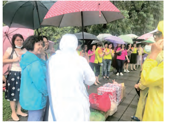
▲雨中分送餐盒的盛況