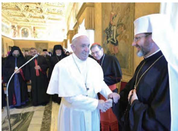
▲教宗接見東方禮教會主教，期勉同道偕行。

與會的歐洲天主教東方禮主教在第22屆年度會議結束之際，前往梵蒂岡晉見教宗。本屆會