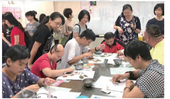
▲認真創作，看到孩子們的潛能。

道來的生命故事，觸動人心！使得下午的活動好似一次小避靜，在遠離塵囂走向自然與簡樸的世界中，領會天主奇妙的化工，感謝天主！