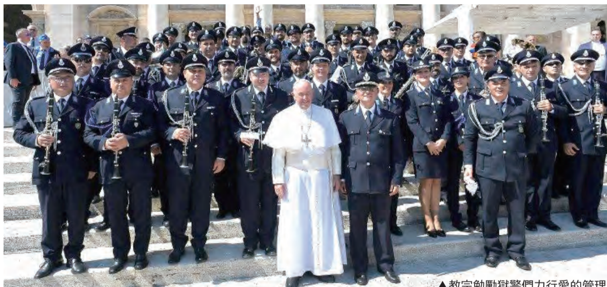
▲教宗勉勵獄警們力行愛的管理

此外，還有一位主教和一位修女。這些梵蒂岡的運動員代表了18個國家，充分展現聖座的普世性。